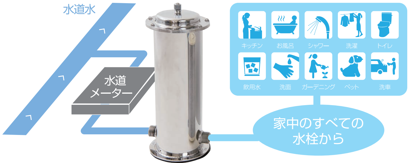
戸建て住宅の場合

家中の水栓に浄水器を取り付けることは現実的ではありません。ウォーターシステムは家庭内における水の入り口に取り付けるという革命的な新発想から生まれた高処理能力を誇る浄活水装置です。暮らしに関わるすべての水を浄活水化させ、家庭内すべての水栓へ送水します。