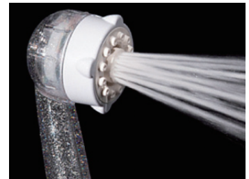
【マイクロバブルストレート水流】 ダイレクトに感じるストレート水流