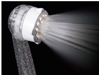
【ウルトラファインバブルミスト +マイクロバブルストレート水流】 無段階切り替えで両方の水流を同時に 使うことも可能