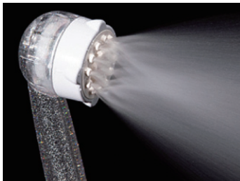
【ウルトラファインバブルミスト水流】 やさしく包み込むミスト水流

ミラブルはウルトラファインバブルを含むミスト水流とマイクロバブルを含んだストレート水流をお好みのポジションでご使用いただけます。